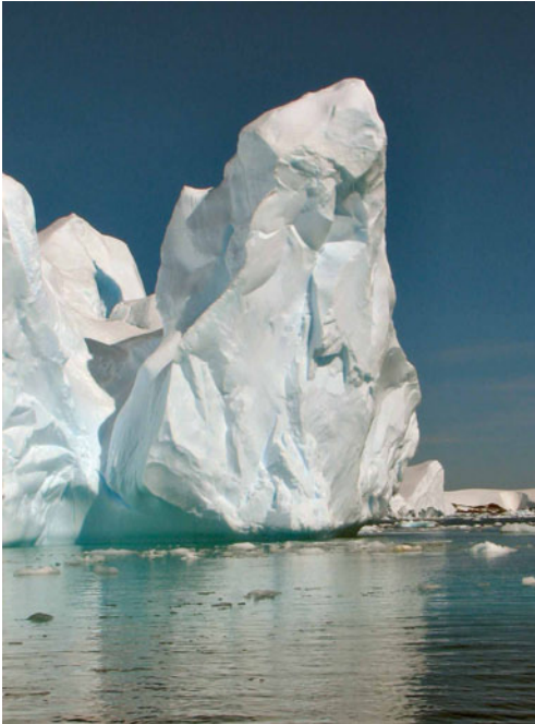
Smeltende ijsbergen: het resultaat van global warming.

onze nachtelijke buitentemperatuur vaak lager is dan 15 graden Celsius kan deze worden aangewend voor zogenaamde vrije koeling. Ook oude begrippen zoals adiabatische koeling en ijswaterbuffering worden weer tevoorschijn gehaald. Bouwfysisch is er ook veel gaande. Er zijn gebouwen waarbij het beton wordt gemengd met gerecyclede en/of afvalmaterialen. Intelligente gebouwen voorzien van nieuwe materialen die smelten en stollen bij temperaturen rond de 20 graden Celsius. Naast de bouwfysische en bouwtechnische zaken vormt de façade steeds meer een onderdeel van het klimaatontwerp. Het integraal ontwerp werd geboren en verwacht van alle betrokkenen begrip en kennis van elkaars vakgebied. Een mooi voorbeeld is het ELUX systeem, een ontwerpmethodiek die voorkomt dat er bij eerste aanleg meters koper in woningen en gebouwen wordt aangebracht die waarschijnlijk nooit zullen worden gebruikt.